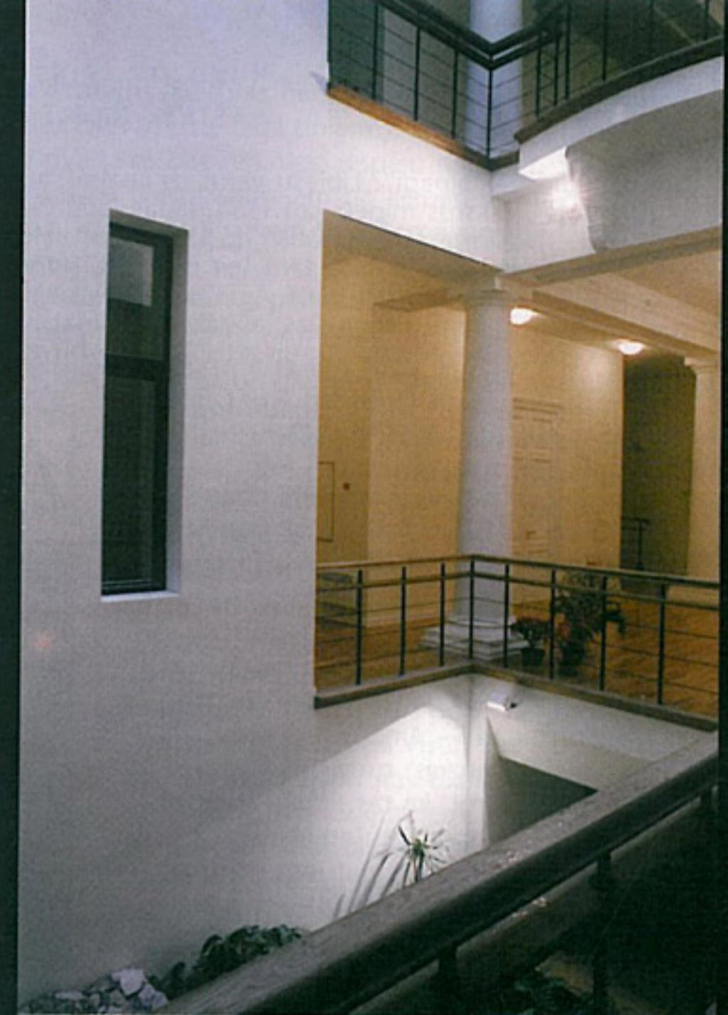
Ēkas rekonstrukcija K. Valdemāra ielā 19.

Bet varbūt mēs tās lietas zinām labāk, varbūt no mūsu puses ir jābūt zināmam profesio-