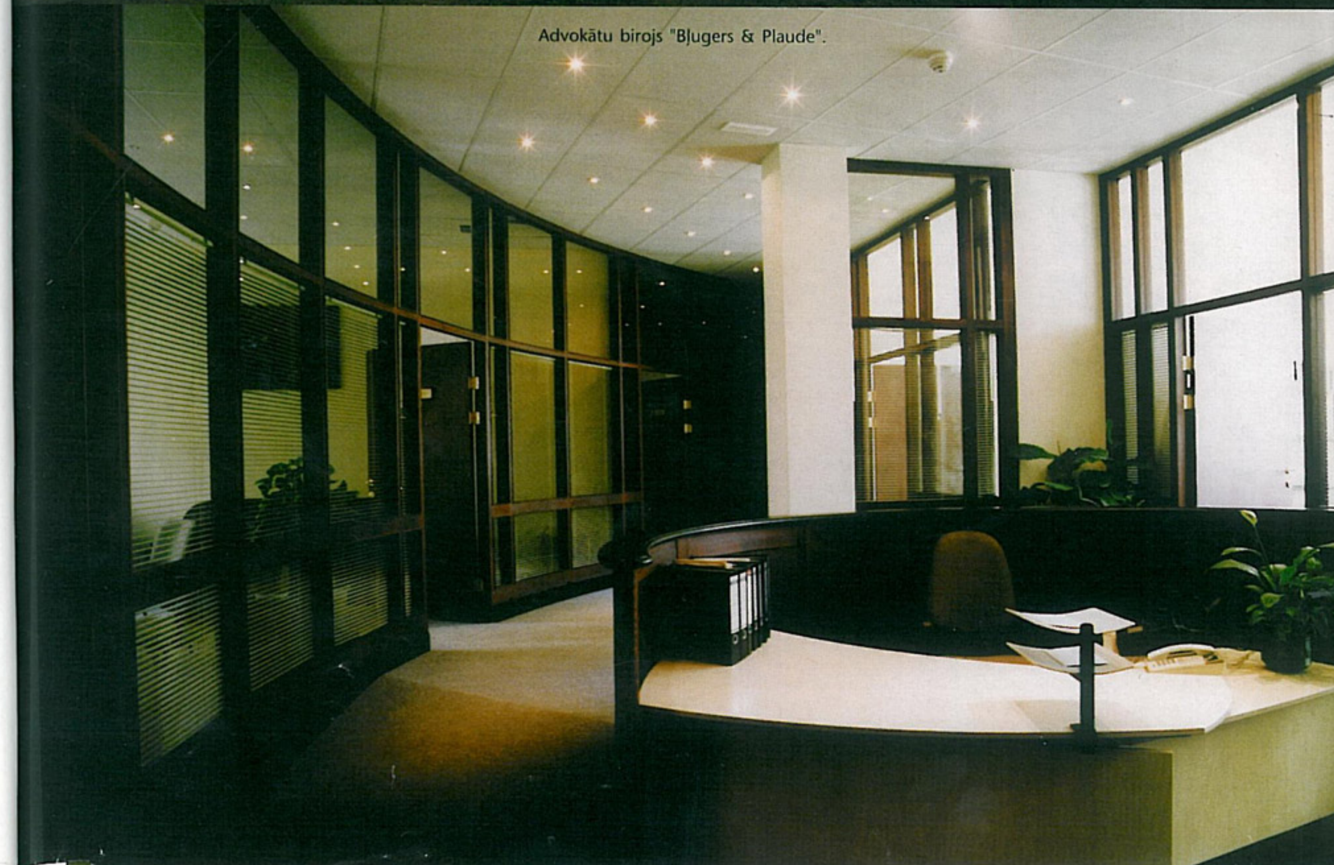
Advokātu birojs "Bjugers & Plaude".