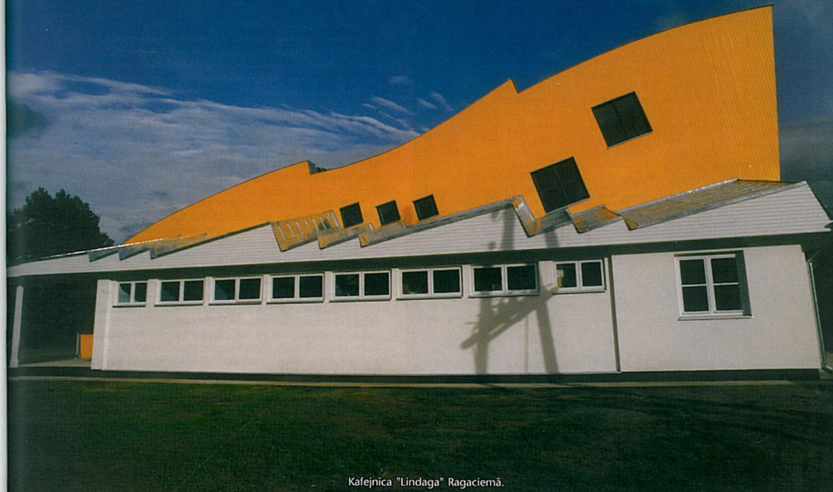
Kafejnīca "Lindaga" Ragaciemā.

Reizēm gadās arī tā. Faktiski visas lietas ir konceptuālas, jautājums — vai tu vienmēr vari uzminēt šo kontekstu tām lietām. Vai tu vari sevi konceptuāli pa-